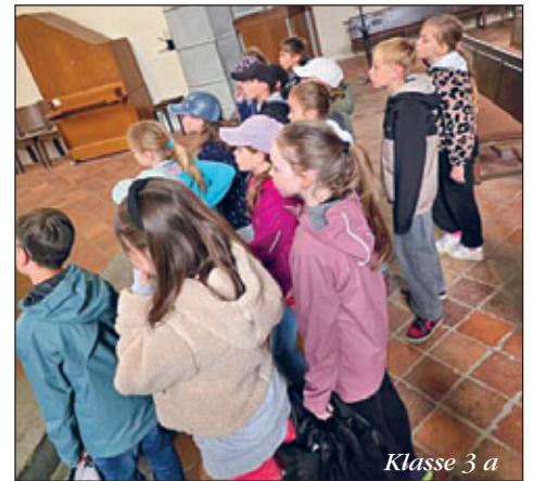
Klasse 3 a