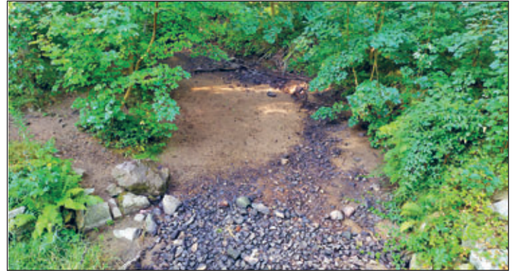
Ein trocken gefallenes Gewässer. Die zahlreichen Strukturen erlauben es den Lebewesen Rückzugsorte zu finden, an denen sie die Trockenphase überdauern können.

Dieser Text entstand in Zusammenarbeit der Fachberaterinnen und Fachberater Gewässer des Landesamtes für Umwelt, Landwirtschaft und Geologie und der unteren Wasserbehörde des Landkreises.