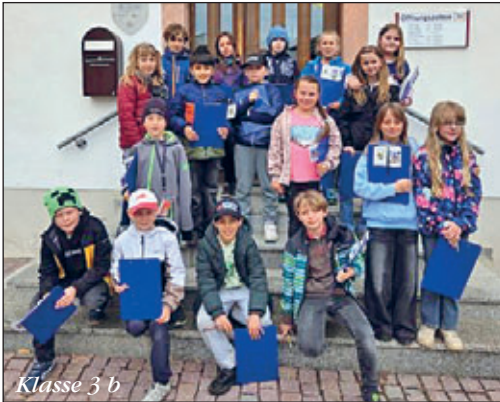
Klasse 3 b

Mit viel neuem Wissen im Gepäck machten wir uns gegen Mittag wieder auf den Heimweg und betrachteten unseren Landkreis mit diesem neuen Wissen in Zukunft vielleicht mit ganz anderen Augen.