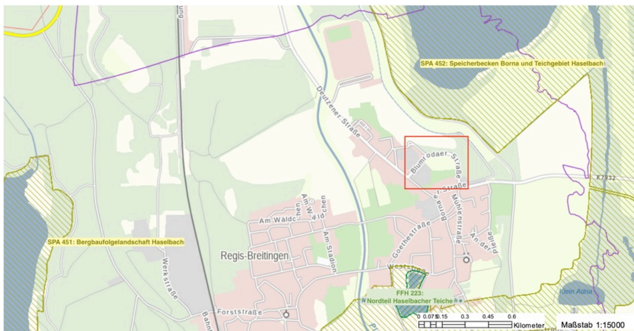
Abbildung 1: Darstellung der Natura-2000-Schutzgebiete und Schutzobjekte nach BNatSchG / SächsNatSchG. Das Plangebiet liegt im rot umrahmten Bereich.

Beeinträchtigungen dieser Natura 2000-Gebiete können aufgrund der Entfernung, der dazwischen liegenden anderen Nutzungen und der Art des Vorhabens als Gewerbe-/ Misch-/ Wohngebiet ausgeschlossen werden. Dies gilt auch für das zunächst liegende SPA mit dem Speicher Borna. Schutzgegenstand ist hier die Wasserfläche einschließlich der Uferbereiche als Lebensraum für rastende und brütende Wasservögel.