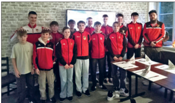
Die C-Jugend am 10.12.25 kurz nach dem Eintreffen in Meuselwitz.

Die C-Jugendmannschaft traf sich im ZIII Meuselwitz, nach 2h Bowling, welches allen sichtlich Spaß bereitete, gab es noch eine Kleinigkeit zu Essen. Da die Sportfreunde noch gut bei Kräften waren, wurde danach noch auf dem Freigelände herumgetollt. Kurz nach 19:00 Uhr waren alle Kinder wieder abgeholt und auf den Weg nach Hause. Übrigens bestand ein Großteil der Mannschaft darauf, trotz Training am Montag und Bowling am Mittwoch, auch das Training am Donnerstag durchführen zu dürfen.