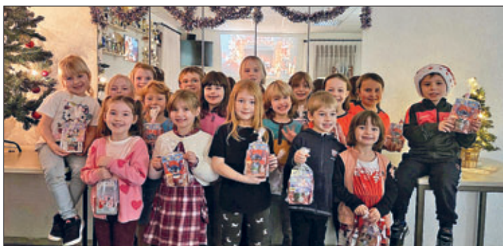
Die jüngere Gruppe der Tanzkinder veranstaltete ihre Weihnachtsfeier am Freitag den 12. 12. 2025.

Die Tanz-Minis des FSV Ramsdorf blicken auf eine besondere Weihnachtsfeier zurück.