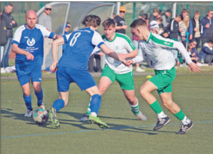
Es war Pleißestädter Derbyzeit