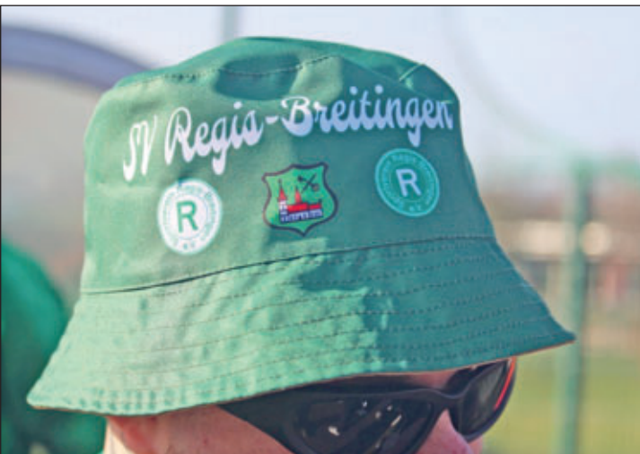
Das schöne Detail, Handball(er) und ein Aktivistas-Hut