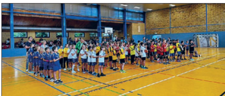
Der 2. Blaue Diamant wurde als Vorbereitungsturnier in der SH Borna Ost durchgeführt