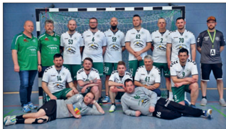
SVR 2.Männer Saison 2022/2023