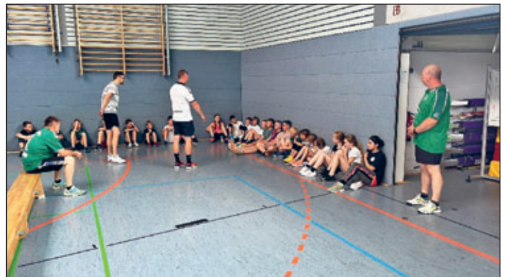
Trainingslager in Borna und Regis-Breitungen am 17./18.06.2023