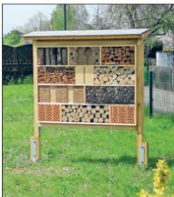
Insektenhotel in unserem „Kinder-Garten“

Nun zu einem anderen Thema: Wir möchten in einem leerstehenden Garten eine kleine Oase für Kinder errichten. Dieses Projekt soll die Kinder aus dem Kindergarten und der Grundschule zum Verweilen und Entdecken einladen. Sicher haben Sie schon bemerkt, dass in dem vorgesehenen Garten bereits mit dem Aufbau eines Insektenhotels begonnen wurde. Im September werden wir dann noch Obstbäume und Beeresträucher anpflanzen.