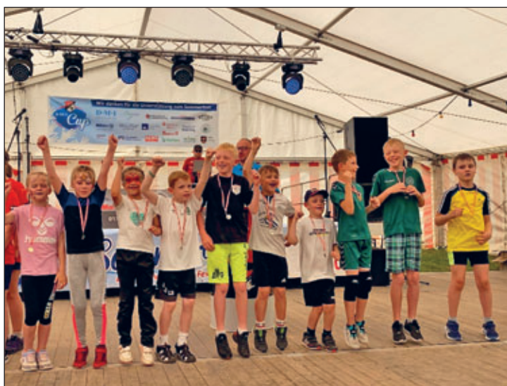
Erstmaliges Spielen unter Wettkampfbedingungen für die neue E-Jugend der NSG Neuseenland – Erfolgreiche Teilnahme beim DMI Cup in Leisnig am 24.06.2023