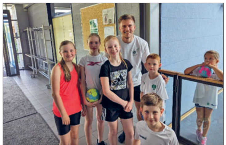
Abwechslungsreich und intensiv war das Wochenende für die Kinder der NSG Prominenter Überraschungsbesuch am zweiten Trainingstag in Regis – Bundesliga Profi Franz Semper lässt sich mit den Kids ablichten